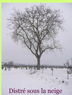
Distré sous la neige