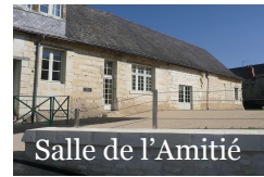
Salle de l'Amitié