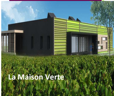
La Maison Verte

Cette structure s'inscrit dans un contexte plus large de complexe intergénérationnel alliant petite enfance et logements pour seniors.