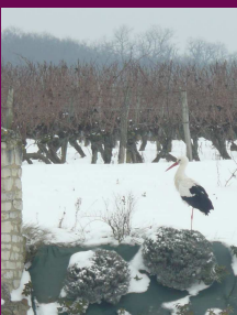
Une cigogne à Distré