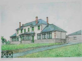
Ecole de Distré

« Plus d'arbres, plus de vie » une action menée sur le terrain par les enfants de l'école des vignes de Distré