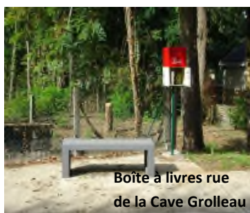
Boîte à livres rue de la Cave Grolleau

Plus d'infos: Téléphone : 09 77 80 98 37 Email : aecd49@orange.fr