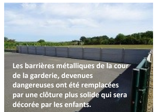
Les barrières métalliques de la cour de la garderie, devenues dangereuses ont été remplacées par une clôture plus solide qui sera décorée par les enfants.

Comme chaque année, nous avons profité des vacances d'été pour entretenir notre école et y apporter des aménagements pour accueillir les enfants dans de bonnes conditions. Les petits découvriront une structure de jeux qui a été montée dans la cour maternelle.