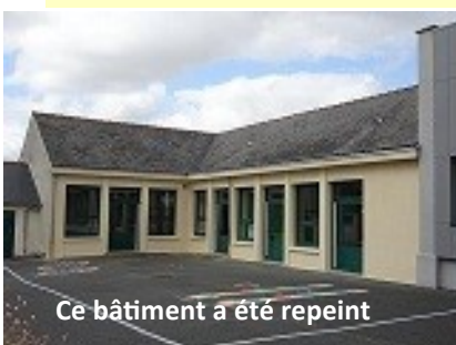
Ce bâtiment a été repeint

Comme chaque année, nous avons profité des vacances d'été pour entretenir notre école et y apporter des aménagements pour accueillir les enfants dans de bonnes conditions. Les petits découvriront une structure de jeux qui a été montée dans la cour maternelle.